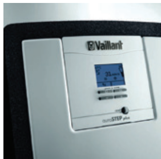
Ingebouwde regeling met zonne-opbrengst